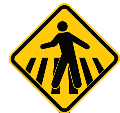
VISTA FRONTAL ESC.: 1:10