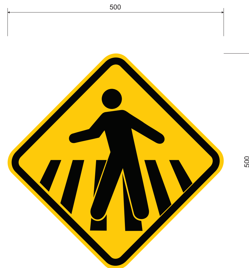
LAYOUT DA PLACA ESC.: 1:5